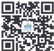
QR CODE เพจ WEBSITE PMKU