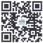
QR CODE เพจ FACEBOOK PMKU